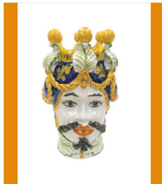
TMC2Uxx variante 11