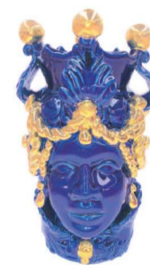
TMC2Dxx variante 4