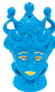
TMC2Dxx variante 3