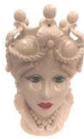
TMC1Dxx variante 6