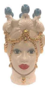
TMC2Dxx variante 7