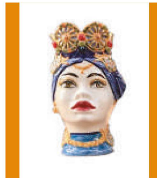
TMC3Dxx variante 12