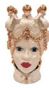
TMC2Dxx variante 8