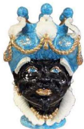
TMC1Uxx variante 13