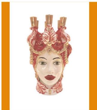
TMC2D48C variante 17