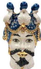
TMC2Dxx variante 15