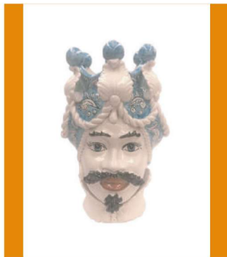
TMC2Dxx variante 10