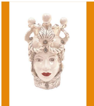
TMC2Dxx variante 9