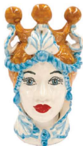
TMC2Dxx variante 1