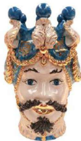
TMC2Uxx variante 14