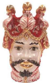
TMC2Uxx variante 5