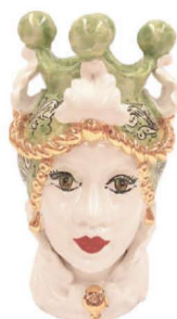
TMC2Dxx variante 2