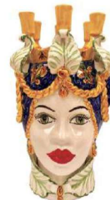
TMC2D48C variante 16