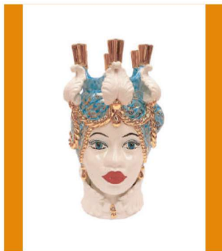
TMC2D48C variante 18